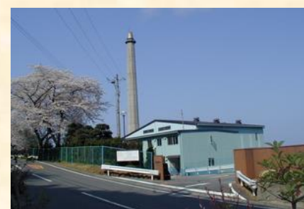
土肥戸田衛生センター

土肥戸田衛生センターは当時の土肥町と戸田村の広域施設として昭和62年4月にストーカ式焼却方式（30トン/日）で操業を開始しました。35年間お世話になりました。