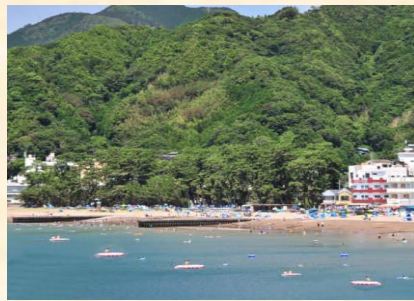
海水浴客で賑わう松原公園前

命を守り、観光推進に寄与する土肥地区のシンボリックな施設になるよう願っています。